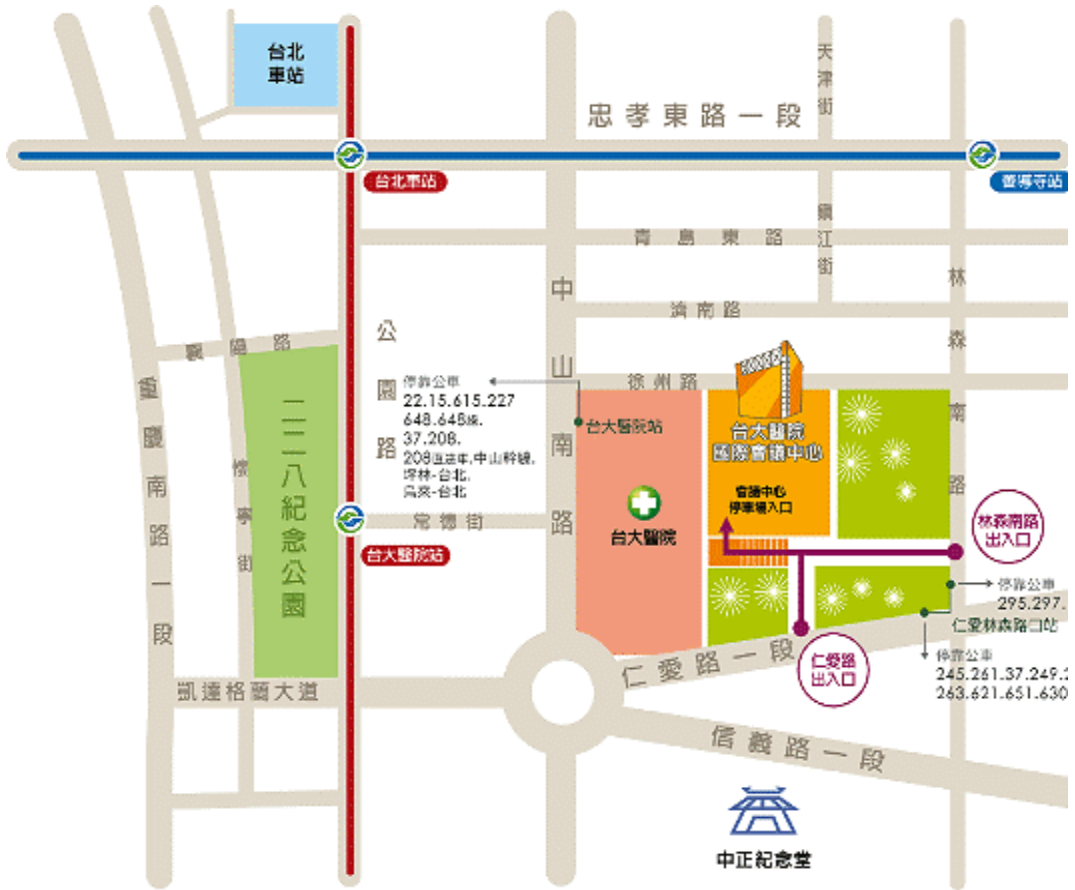
● 會議中心停車場動線圖